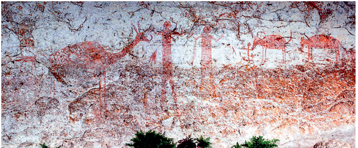
Fig. 6. Des peintures peu visibles d'humains et d'animaux, de Style Monochrome Rouge, s'aperçoivent difficilement sur la paroi au-dessus d'une source à Painted Shelter. Elles sont superposées à ce qui subsiste de figures antérieures de Style Pecos River. Les auteurs du Style Monochrome Rouge rendaient les humains de manière plus réaliste que ceux que l'on trouve dans le Style Pecos River.

animals painted in varying shades of red. Rigid, human forms are solidly painted and portrayed frontally with their arms bent at the elbow, forearms raised, and legs apart. Heads are round, but lack facial features. They are more realistically depicted than the Pecos River style anthropomorphs, often with hands and feet, fingers and toes, and gender markers. Some males are portrayed with genitals. Females have a rounded protuberance on each side of their head resembling Hopi Indian maiden whorls, a hairstyle formed by coiling the hair into buns above each ear. At least one female figure also appears to be wearing a dress. Single feather headdresses, tassels hanging from the arms, and wrist adornments decorate many of the figures. Numerous anthropomorphs are impaled with spears or arrows, although none of the animals are so stricken (Fig. 6).