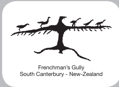
Frenchman's Gully South Canterbury - New-Zealand

Responsable de la publication - Editor : Dr. Jean CLOTES