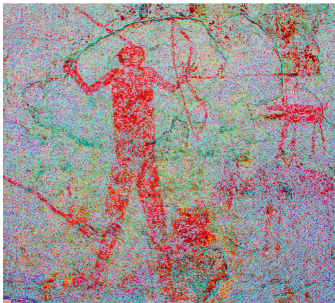
Fig. 7. Style Monochrome Rouge à Painted Shelter. Homme coiffé d'une plume et armé d'un arc recourbé. Cliché Shumla Archaeological Research and Education Center.

Red Linear style is typically characterized by animated, small, fine-lined figures of animals and humans. Although the style is referred to as "Red Linear," implying the use