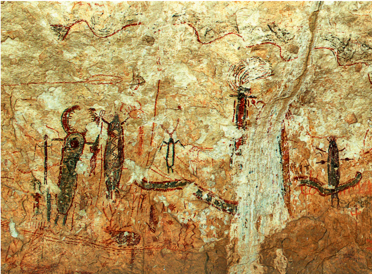
Fig. 3. L'abri de Halo se trouve dans un canyon affluent de la Devils River. Les peintures de Style Pecos River, en rouge, jaune, noir et blanc, s'étendent sur près de 30 m de long. La photographie représente environ 10 m de la partie la mieux conservée.