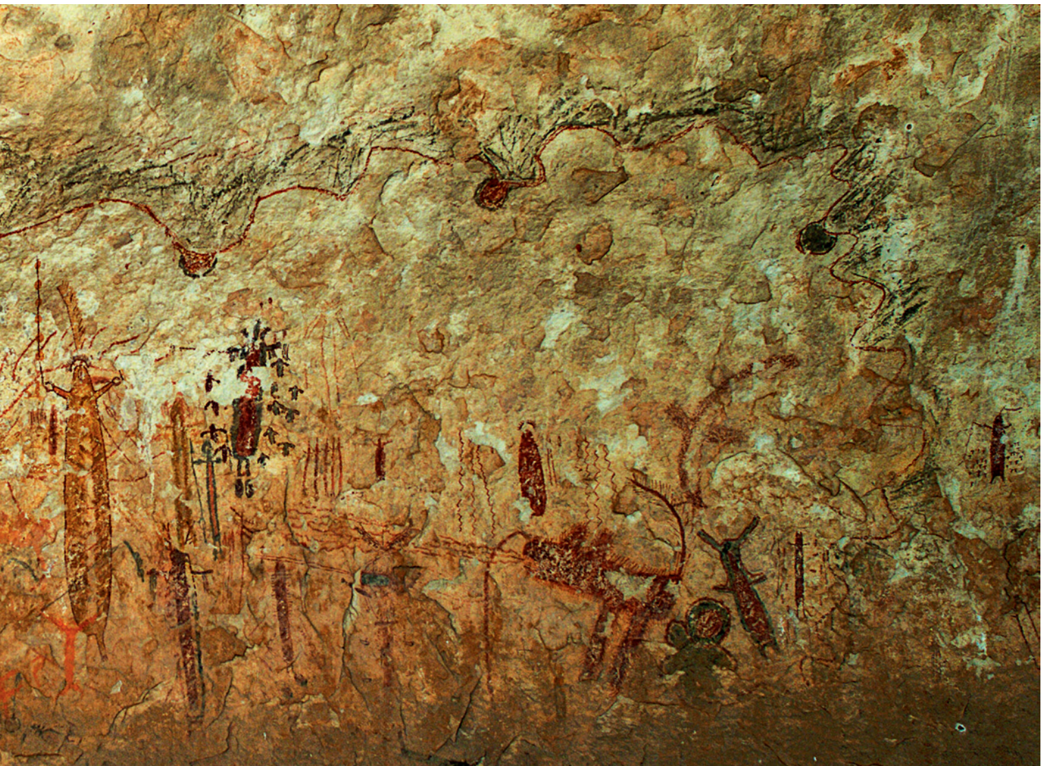
Fig. 3. Halo Shelter is located in a tributary canyon of the Devils River. Pecos River style pictographs painted in red, yellow, black, and white span almost 100 feet along the wall of this shelter. This photograph represents about 30 feet of the best preserved portion of the mural.

A few years later, Kirkland, a commercial draftsman, and his wife, Lula, began producing detailed accurate watercolor renderings of the major sites in Texas. It was the realization that many of the paintings were being "mutilated and destroyed" that prompted the couple to begin this massive undertaking. Before Kirkland's anti-