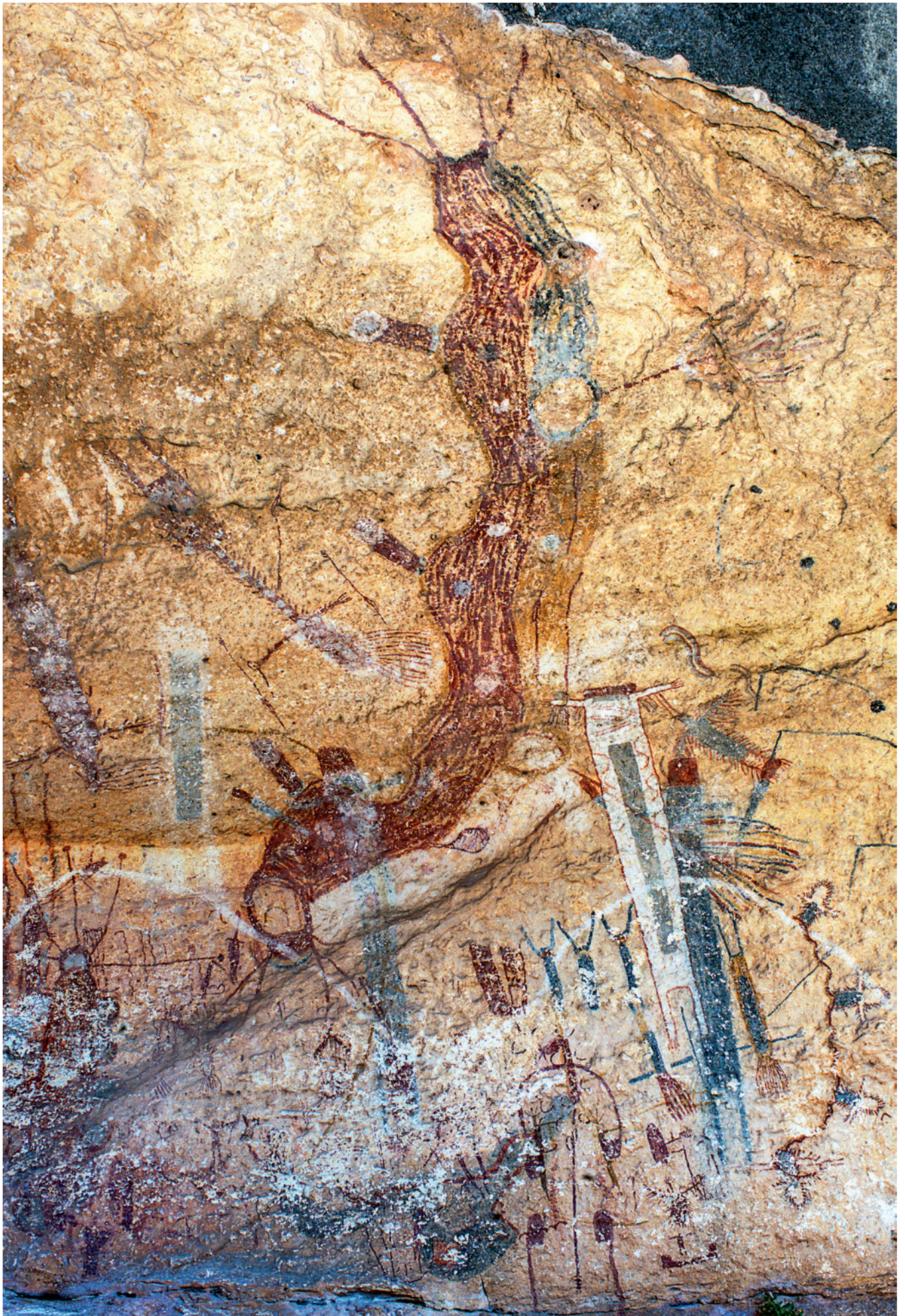
Fig. 11. La fresque de l'abri de White Shaman est l'une des mieux conservées pour le Style Pecos River de la région. L'anthropomorphe blanc qui lui a donné son nom a près d'un mètre de haut.