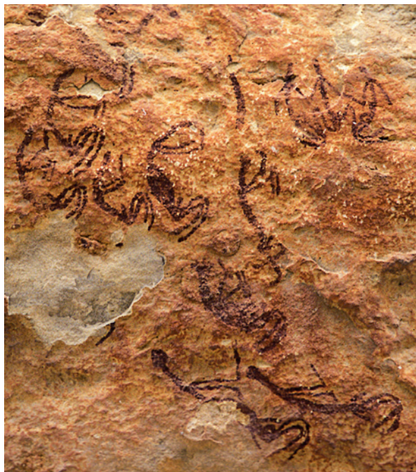
Fig. 9. De petits personnages de Style Rouge Linéaire, aux lignes fluides, donnent une impression de mouvement et de cérémonie sur ce petit panneau de Presa Canyon. Chaque figure a moins de 12 cm. Les hommes ont le phallus érigé et les femmes portent parfois des « jupes ».

En grande majorité, l'art rupestre des canyons du Bas Pecos appartient au style de la Pecos River, avec des caractéristiques qui le rendent unique au monde. Parmi les styles régionaux, c'est le plus complexe et le plus sophistiqué. Au début des années 1990, des prélève-