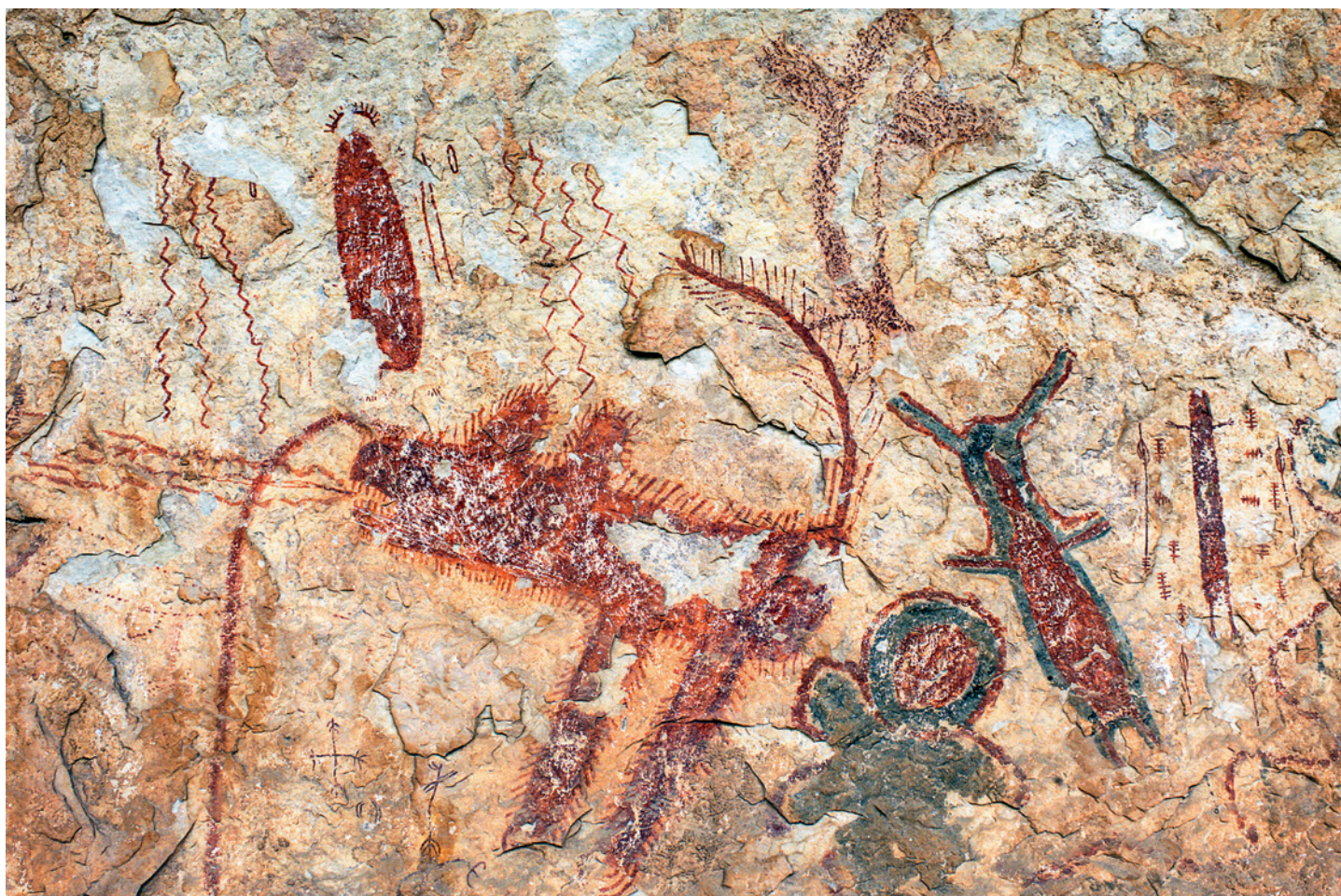
Fig. 13. Dans l'abri de Halo, un félin original à deux pattes, de Style Pecos River, a le poil hérissé. Les lignes onduleuses qui lui sortent de la gueule peuvent représenter la respiration ou des paroles. Le trait rouge épais à partir de son nez pourrait être du sang ou une émission de mucosités, phénomènes connus comme des effets possibles d'états de transe induits par des efforts physiques extrêmes ou l'usage de plantes hallucinogènes.

Animals are portrayed in the Pecos River style paintings. Deer and felines are the most common, birds and canines to a lesser degree (Fig. 13). Some imagery resembles insects, such as caterpillars, dragonflies, and moths or butterflies. Sinuous, snake-like figures are also portrayed in the rock art.