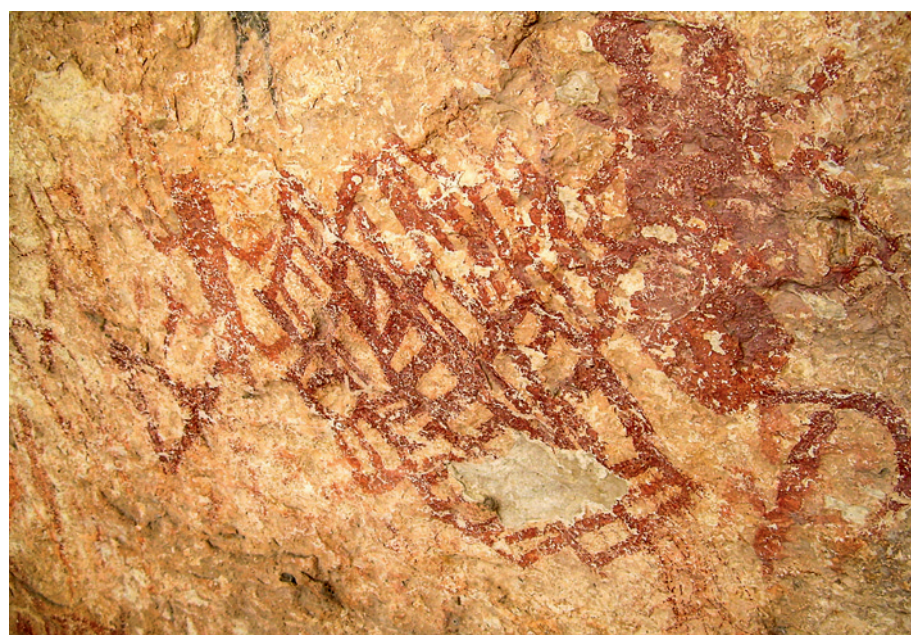
Fig. 8. Le Style Géométrique à Ligne ferme, comme son nom l'indique, se caractérise par des lignes géométriques fermes avec des motifs en zigzag et de petites figures d'humains et d'insectes, comme ici à Parida Cave près du Rio Grande.