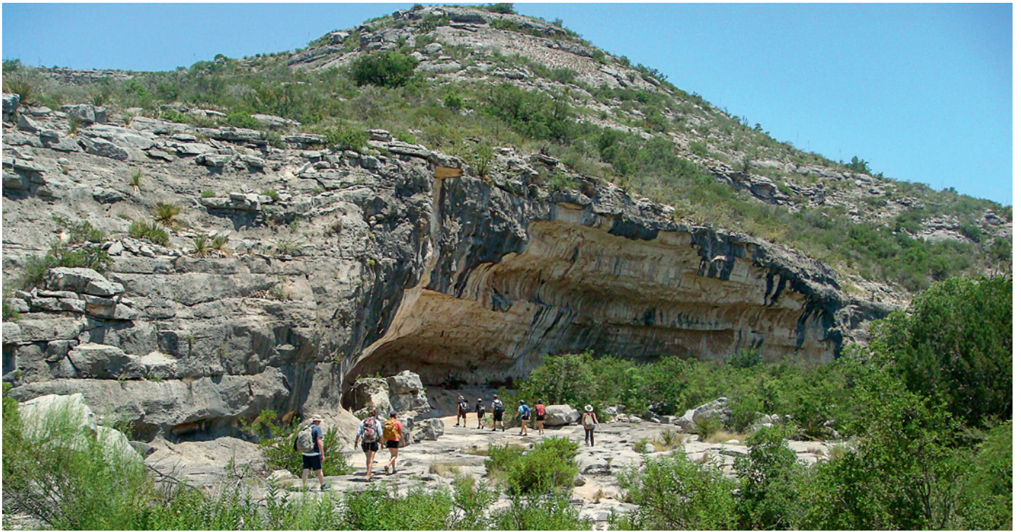
Fig. 2. De vastes abris, comme celui-ci à Cedar Springs, offraient tout à la fois un refuge et des parois calcaires aptes à accueillir les peintures narratives.