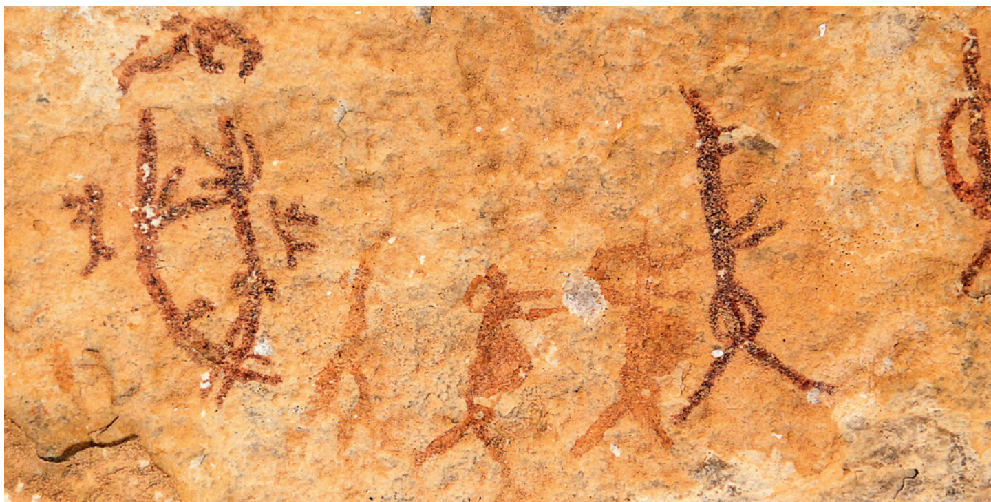
Fig. 10. Le Style Rouge Linéaire met l'accent sur la fertilité en représentant des femmes enceintes et des scènes de copulation.

Exquisite in detail and masterful in execution, the Pecos River style murals document myths, histories, and rituals of people living in the Lower Pecos Canyonlands thousands of years ago. Artists used an array of earth colors to create elaborate murals that are impressive in the level of skill required to produce them, as well as sheer size and complexity. Some of the panels are massive, spanning over 100 feet in length and 30 feet in height —dimensions requiring significant planning and construction of scaffolding and ladders. Other panels are quite small, tucked away in secluded alcoves high above the canyon floor.