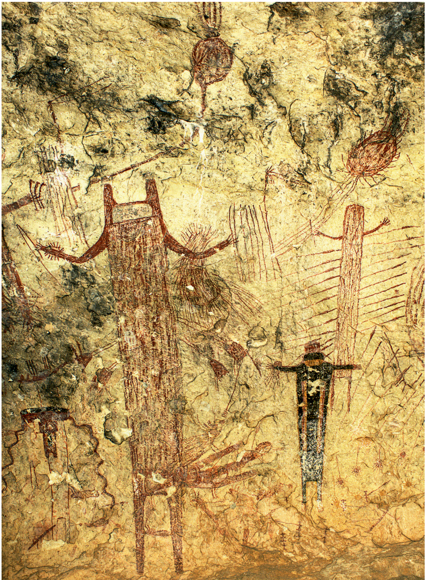
Fig. 12. L'anthropomorphe de l'abri de Halo, de Style Pecos River, a une tête en U, mesure plus de 3 m de haut et porte divers objets. A la main droite il a un propulseur et une sagaie, à la main gauche des sagaies, un bâton et un ballot de datura chargé de pouvoir. Son poignet droit est orné et une sorte de bourse pend à son poignet gauche. À la taille, il a des houppes et sur la hanche un ensemble de plumes possibles.