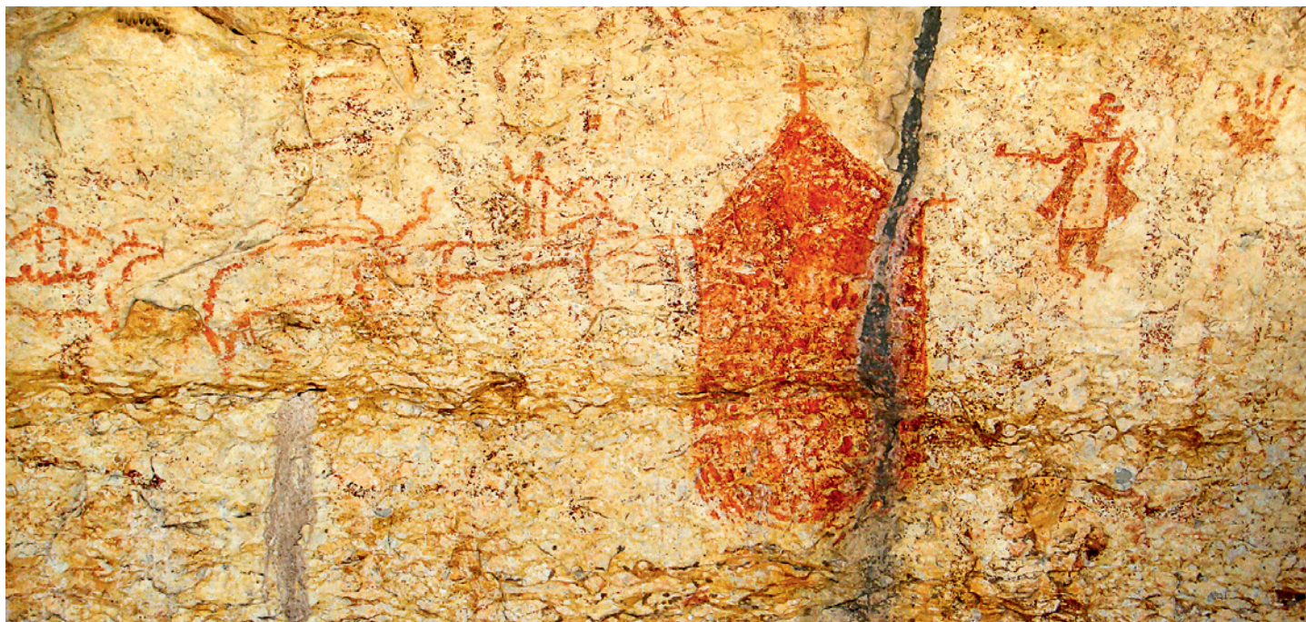
Fig. 4. L'abri de Vaquero, dans le Parc national de Seminole Canyon, présente de nombreux exemples d'art rupestre de la période Historique, comme ici avec une église, des cavaliers et un blanc en costume d'époque.

Du nord du Mexique aux canyons de l'Utah, les artistes de la période Historique ont transcrit ces premiers contacts dans leur art rupestre. Nous y constatons l'intérêt pour les animaux domestiques, tels que chevaux et gros bétail, ainsi que pour les vêtements et les équipements des Espagnols. La représentation d'églises à dômes et à deux tours, ainsi que celle d'architectures plus grandes que celle de la proche Mission San Lorenzo sur la Rivière Nueces, prouvent que les Indiens locaux connaissaient des endroits plus éloignés (fig. 4).