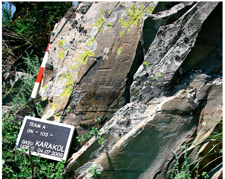
Fig. 2. Gravures sur un éperon poli dans la vallée de Karakol. Photo prise en juillet 2009 près de Boochi.