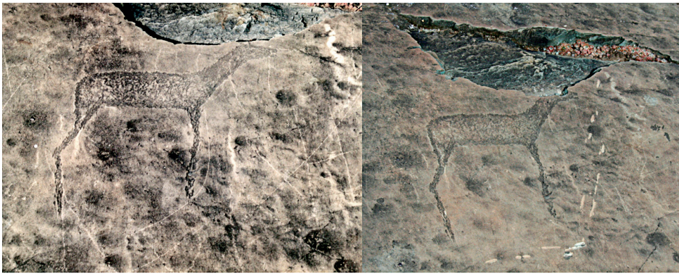
Fig. 6. Figure de cheval avant et après destruction. L'image de gauche montrant le cheval complet a été prise en 2003, la vue récente (2010) montre le cheval sans tête avec les marques de ciseau.

Fig. 6. Representation of a horse before and after the disturbance. The left picture was taken in 2003 and shows the entire horse; the recent picture (2010) shows the horse without a head and clear chisel marks.