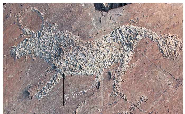
Fig. 4. Exemple d'une représentation de taureau endommagée. Un graffiti très récent en cyrillique (cf. encadré) se superpose à la patte d'un taureau vieux de plus d'un millénaire. Photo prise en juillet 2003 à Elangash.

Research itself – although without being the intention of the rock art specialist – can also be harmful. Most recordings have been carried out using traditional methods such as freehand drawing, tracing, rubbing and casting. While tracing, rubbing and casting have the advantage of representing the prehistoric carvings in an orthogonal and more realistic way (Cassen & Robin 2010), they are invasive techniques that affect the preservation of the rock art – especially the more weathered panels (Simpson