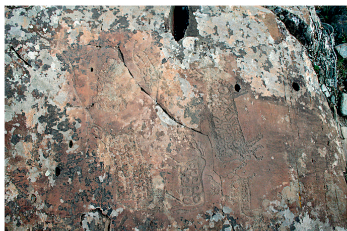
Fig. 3. Exemple d'un rocher gravé devenu illisible en raison de l'altération par les cycles gel-dégel et d'une prolifération de lichens. Photo prise en août 2009 à Kabalk-Tash.

La recherche elle-même – loin des intentions des spécialistes de l'art rupestre – peut aussi être nuisible. Les méthodes traditionnelles telles que dessin à main levée, relevé, frottage et moulage sont le plus souvent utilisées. Bien que les trois dernières aient l'avantage de reproduire les gravures préhistoriques de façon orthogonale et plus réaliste (Cassen & Robin, 2010), ce sont des techniques agressives qui affectent la conservation – surtout pour les panneaux déjà altérés (Simpson et al. , 2004 ; Cassen &